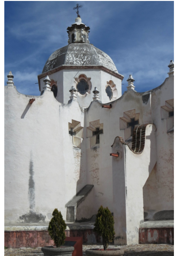
Parte de la fachada del Santuario de Atotonilco.