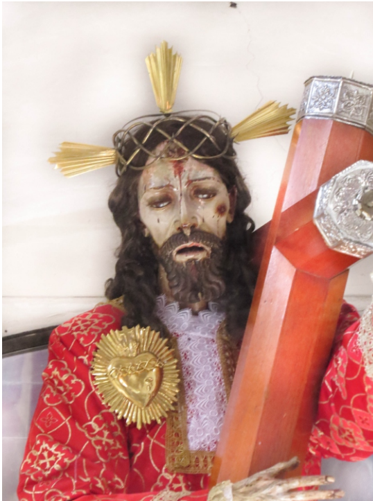
Venerable Imagen de Jesús Nazareno