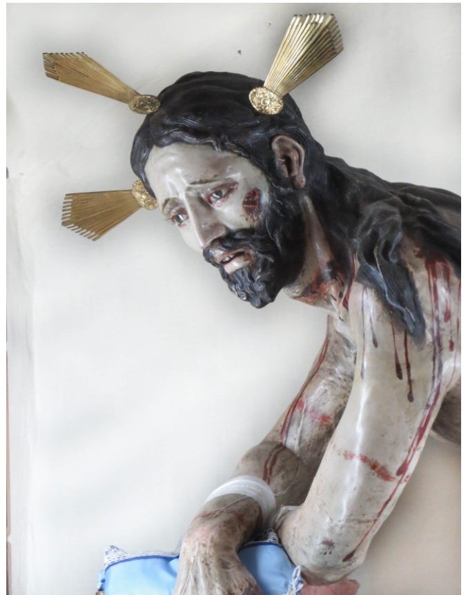
Milagrosa Imagen del Sr. de la Columna.