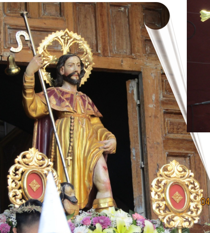
Imagen Parte superior izquierda: Divino Maestro.